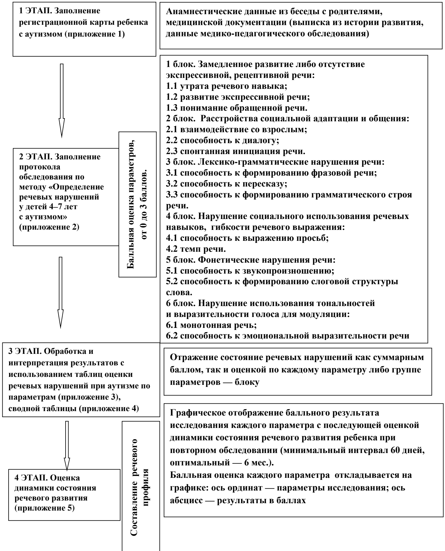
Схема процедуры обследования