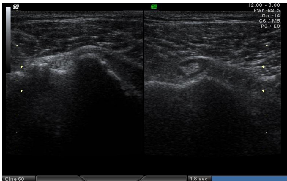
Рисунок 2 — Умеренное скопление жидкости во влагалище длинной головки бицепса левого плечевого сустава

Таким образом, предлагаемая совокупность таких ультразвуковых признаков адгезивного капсулита, как ограничение подвижности ротаторной манжеты при динамическом исследовании, избыток жидкости во влагалище длинной головки бицепса при отсутствии ее в полости сустава, утолщение капсулы сустава в области подмышечного кармана по сравнению с контралатеральной стороной обеспечивает возможность более точной и ранней диагностики адгезивного капсулита плечевого сустава.